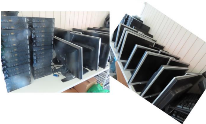
Datamaskiner og skjermer

Vi har sendt 2 paller med 61 lekke datamaskiner fra Bingsfoss Ungdomsskole. I tillegg fikk hornorkesteret 26 instrumenter pluss komplette draktsett til alle musikantene. Et norsk hornorkester fikk laget nye drakter, men fargen på logoen var feil, så da har Aksjon Vennskap fått alle draktene. Det er kjempestas.