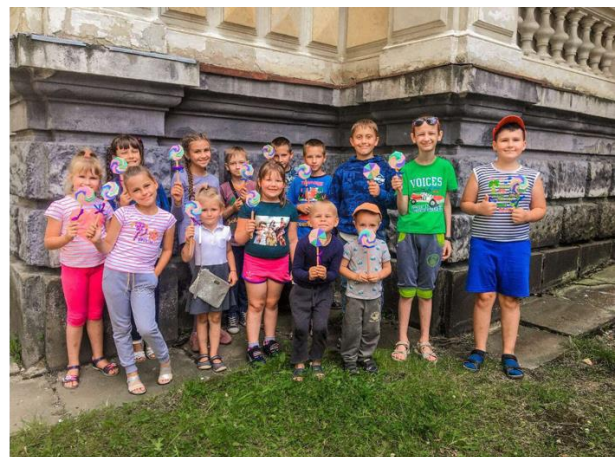
Sommerleir er gøy!

Spesielt for barn på barnehjem som kanskje ikke har noen andre tilbud hele sommeren