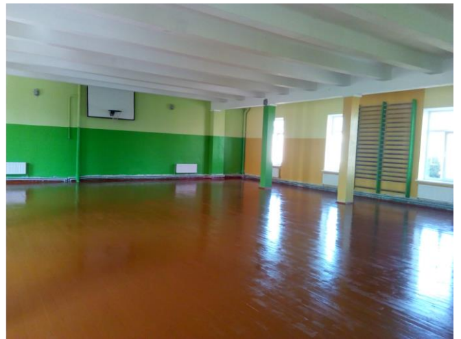
Slik ser den ut nå. Helt super og klar til bruk