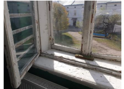
Slik så gymsalen ut før