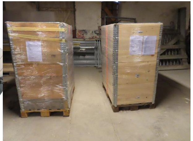
Klart for sending til barnehjemmet i Chyryv