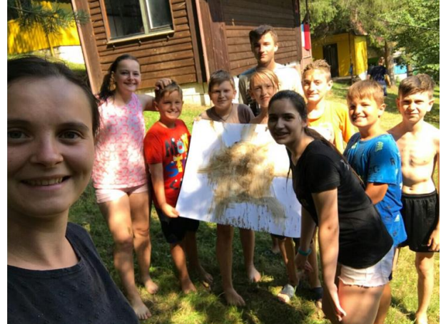
På Sommerleir lager man mat, trimmer, lager kunst og er sammen med venner